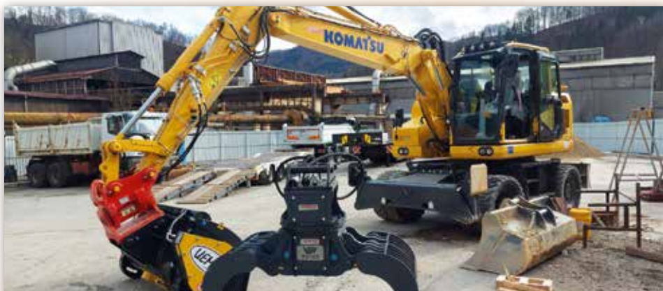
Na fotografii je zachycena dodávka kolového rýpadla PW158-11 se lžící a 2 výložníky, joystickovým ovládáním a systémem Powertilt. Aby byl tento stroj dokonale využit, byla zakoupena také lžice na míchání betonu Uemme Condor 450 a demoliční drapák VTN MD140.

nakladačů WA470-8 a WA475-10, dvou rýpadel PC210NLC-11 a jednoho zařízení PC360NLC-11, jednoho minirýpadla a jednoho midirýpadla rozšířila společnost Gradnje Žveplan d.o.o. svůj vozový park o nedávno pořízené kolové rýpadlo Komatsu PW158-11.