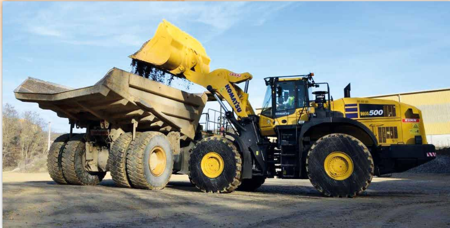
Stroj WA500-8E0 s přesným ovládáním a vysoce účinnou lžící připravený k použití s vysokou produktivitou

Společnost Lafarge si také zakládá na své dlouholeté spolupráci se společností Kuhn.