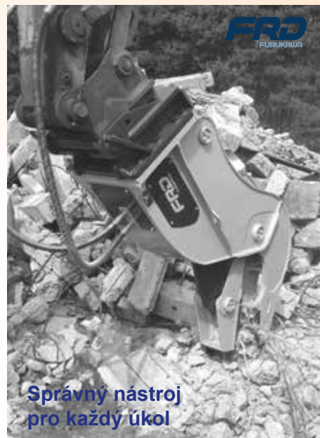
Správný nástroj pro každý úkol