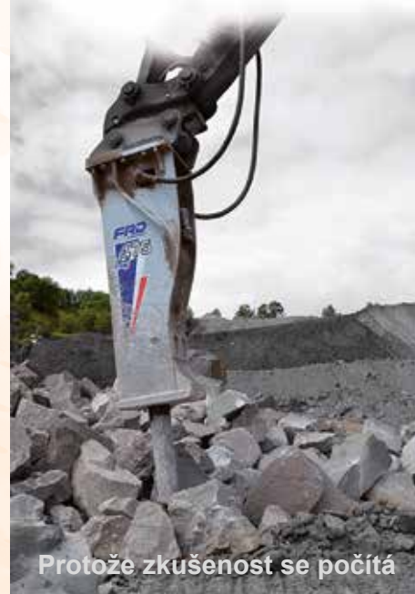
Protože zkušenost se počítá