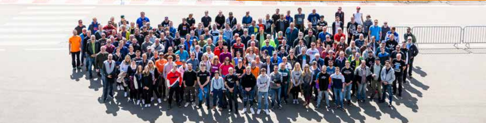
Fotografie z akce pro zaměstnance na okruhu Red Bull Ring